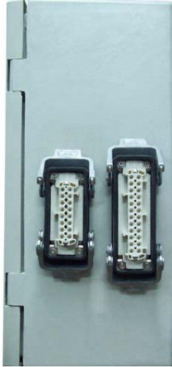
Kumanda Panosu Yandan Görünüş